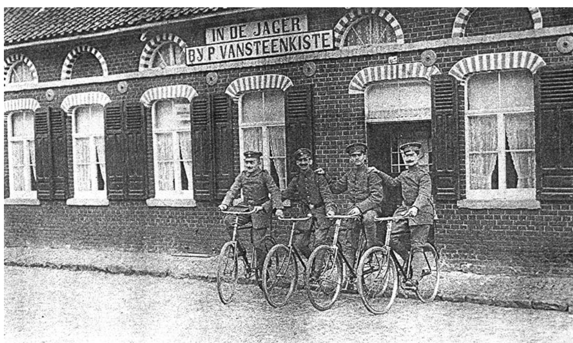
Wereldoorlog I: Duitse soldaten poseren voor herberg 'In de Jager'