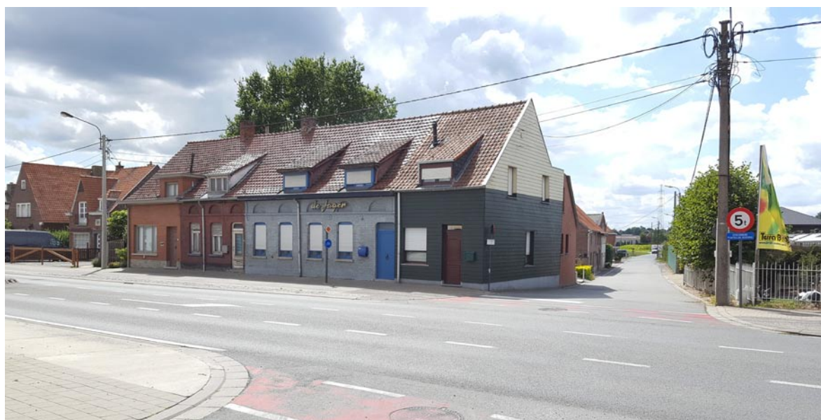
Huidige situatie (2017)